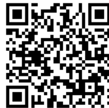
申込ページ QR コード